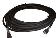
20 mt delivery hose kit with quick coupler M24x1,5 DKO Kit tubo mandata 20 mt con attacchi rapidi M24x1,5 DKO